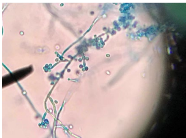
Figura 5 - Microscopia direta da cultura demonstrando hifas hialinas, septadas, delicadas e ramificadas com conidióforos e conídios dispostos em arranjo de "margarida".

demonstraram colônias de aspecto membranoso, de coloração bege com halo enegrecido (Fig. 4) que à microscopia mostraram ser hifas hialinas, septadas, delicadas e ramificadas com conidióforos e conídios dispostos em arranjo de margarida, características de Sporothrix spp. (Fig. 5). O exame histopatológico mostrou infiltrado inflamatório difuso misto e linfocitário, com formação de granulomas supurativos na derme profunda além de células gigantes ao redor. Na coloração pelo period acid-Schiff (PAS) foi evidenciado pequeno esporo de aspecto ovalado no interior de um granuloma - (Fig. 6).