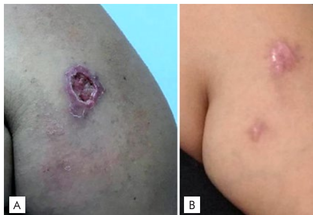
Figura 1 - (A) Lesão ulcerada no braço esquerdo, com bordos infiltrados e eritematosos, associada a trajeto eritematoso distal, onde era possível palpar nódulo. (B) Cicatriz da lesão após término do tratamento.

Paciente do sexo feminino, 32 anos, sem comorbilidades, apresentando há 20 dias lesão ulcerada no braço esquerdo, com bordos infiltrados e eritematosos, fundo sujo e friável de 3,0 x 2,0 cm, associada a trajeto eritematoso distal a úlcera, onde era possível palpar nódulo (Fig. 1A). De notar ainda, há 2 dias linfonodomegalias na cadeia cervical direita e edema em pálpebra superior ipsilateral (Fig. 2), sendo possível observar à eversão da pálpebra pápulo-nódulo da conjuntiva palpebral superior com saída de pequena quantidade de secreção purulenta (Fig. 3). Refere tratamento prévio com cefalexina por sete dias sem melhoria. Relata ter gato doméstico, vacinado e saudável, mas refere cinco dias antes do aparecimento das lesões arranhadura pelo gato da irmã que apresentava duas lesões ulceradas, na cabeça e tronco. Formulou-se a hipótese diagnóstica de esporotricose e foram realizadas análises de rotina e sorologias para vírus da imunodeficiência humana (VIH) e hepatites (normais ou negativas), coletados materiais para exame micológico e realizada biópsia da lesão ulcerada no braço esquerdo. As culturas em ágar-Sabouraud