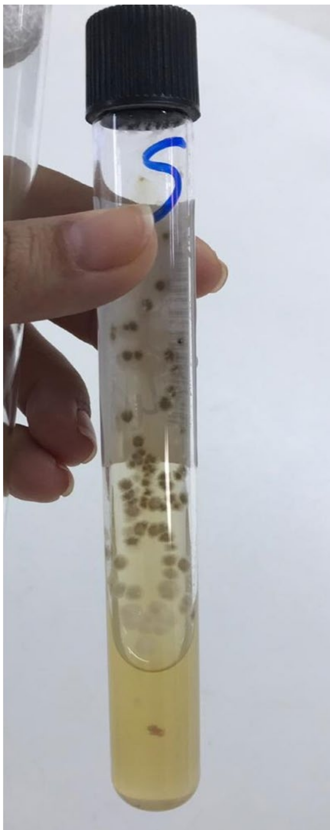
Figura 4 - Cultura em meio ágar-Sabouraud demonstrando colônias de aspecto membranoso e coloração bege com halo enegrecido.