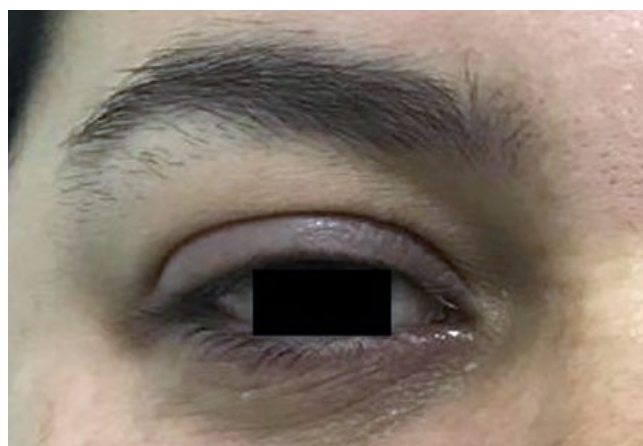
Figura 2 - Edema na pálpebra superior direita.