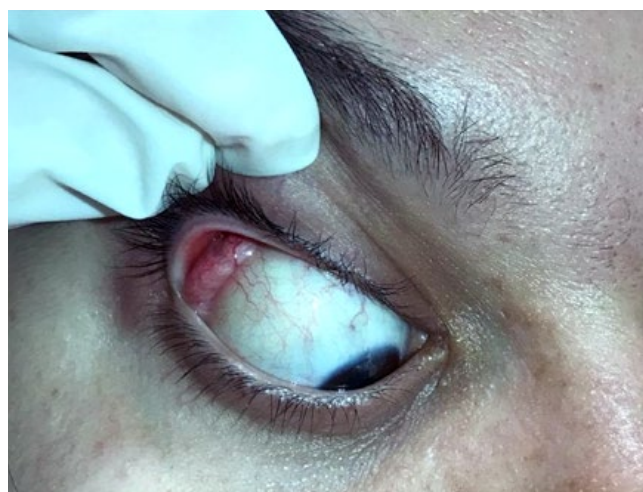
Figura 3 - Pápulo-nódulo da conjuntiva palpebral superior com saída de secreção purulenta, visualizada à eversão da pálpebra superior direita.