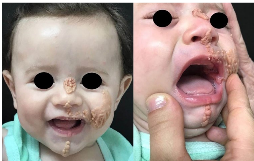
Figura 1 - Pápulas e placas amareladas papilomatosas com distribuição irregularmente linear na hemiface esquerda. Acometimento extenso, inclusive dos lábios e mucosa jugal.

da face. 6 Acomete aproximadamente 0,3% dos indivíduos, sem predileção por sexo. 3,7 Em geral, a lesão está presente desde o nascimento e caracteriza-se por placa bem delimitada constituída por múltiplas pápulas confluentes de coloração amarelo-alaranjada ou amarelo-acastanhada, mais frequentemente no couro cabeludo onde condiciona alopecia. 3