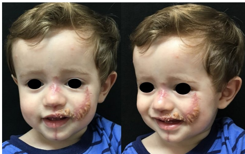
Figura 4 - Evolução após 2 meses da primeira abordagem cirúrgica, em fusão com encerramento borda-a-borda, realizada aos 10 meses de idade.

Por outro lado, o NSJ também pode associar-se a manifestações extracutâneas: déficite cognitivo, convulsões e outras anormalidades do sistema nervoso central, anomalias cardiovasculares, (defeito do septo ventricular, coarctação da aorta, hipoplasia da aorta), oculares (estrabismo, anomalias da retina, coloboma, cataratas, vascularização da córnea e hemangiomas oculares), esqueléticas (displasia fibrosa craniana localizada, hipertrofia ou hipoplasia esquelética, escoliose e cifoescoliose, raquitismo resistente à vitamina D e hipofosfatemia), buco-dentárias (hemi-hiperplasia da língua, cistos ósseos, aplasia dos dentes, esmalte hipoplásico) e urogenitais (rim em forma de ferradura e um sistema duplicado de coleta urinária), constituindo a chamada síndrome do nevo sebáceo linear ou síndrome de Schimmelpenning a qual, pelo exposto acima e revelado em estudos recentes, se estende amplamente além da tríade inicial proposta. 10,13,15