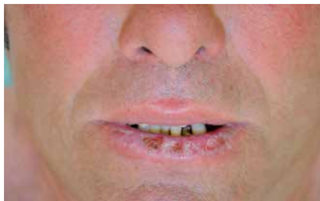
Fig 1 - Queilite actínica do lábio inferior.

A vermelhectomia realizada com estudo histopatológico de secções seriadas é considerada o melhor tratamento em alguns estudos 2,5 . Trata-se de uma opção