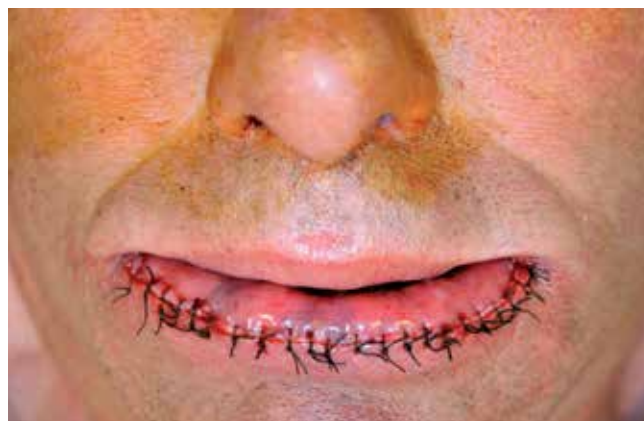
Fig. 3 - Lábio inferior após vermelhectomia.

cirúrgica para muitas lesões do lábio, incluindo a QA, na qual é excisada a totalidade do epitélio, permitindo o estudo histopatológico da totalidade da peça, assim como a determinação da extensão da lesão. Existem diversas variações deste método: a vermelhectomia simples implica a remoção do vermilion apenas ao nível do músculo orbicularis oris . Uma modificação desta técnica pode incluir a excisão de glândulas e tecido muscular. O encerramento da ferida operatória é conseguido através de um retalho de deslizamento da mucosa labial (Figs. 1, 2 e 3). Tradicionalmente este procedimento pode ter várias complicações pós-operatórias, incluindo hematomas, deiscência da sutura, formação de cicatrizes, perda do contorno do lábio e parestesias. Apesar das eventuais complicações, a vermelhectomia é uma técnica extremamente eficaz no tratamento de QA, apesar de ser um procedimento cirúrgico complexo (Fig. 4). Um estudo de Robinson 9 não detectou