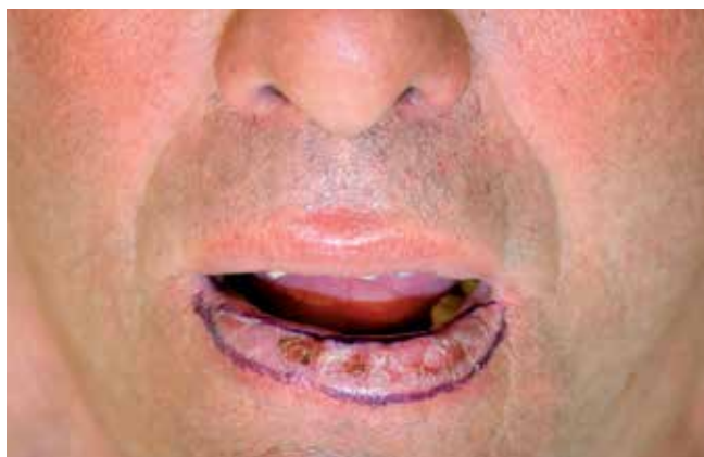
Fig. 2 - Planificação do método cirúrgico.