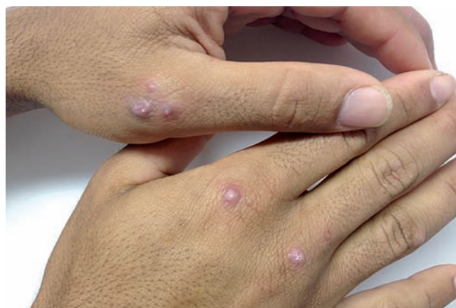
Fig. 1 - Nódulos eritemato violáceos nas regiões metacarpofalangeanas do primeiro quirodáctilo esquerdo e segundo e terceiro quirodáctilos direitos.

bastante significativa de complicações, tais como infecção secundária, formação de granulomas provocados por corpos estranhos, artrite, sinovite e eventual necrose 1,3,4 . Algumas espécies de ouriço-do-mar apresentam veneno termolábil, contido em pequenos tentáculos junto às espículas, de efeito hipotensor, hemolítico, cardiotóxico e neurotóxico 1-3 . Os autores enfatizam a importância da retirada precoce de todas as espículas, independentemente de se reconhecer a espécie responsável pelo acidente, para reduzir a probabilidade de complicações.