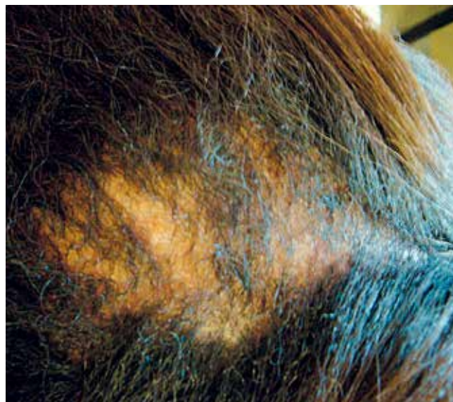
Fig. 1 - Fotografias clínicas da doente do Caso 1 – tinea microsspórica.

Como contexto epidemiológico foi possível apurar contacto com uma sobrinha com tinea capitis , referenciada para tratamento.