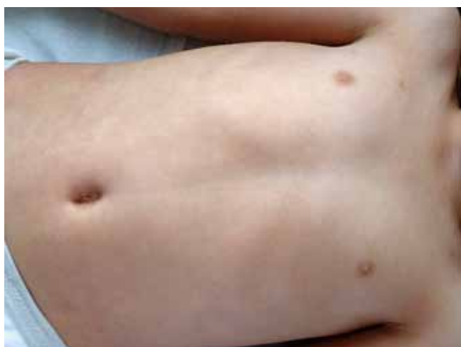
Fig. 5 - Imagem clínica após 18 meses de follow up : Remissão da dermatose.

aparecimento de máculas e manchas hiperpigmentadas de forma dispersa no tegumento cutâneo: eritema discrómico perstans ; pitíriase versicolor; manchas café com leite no contexto ou não de neurofibromatose tipo I; urticária pigmentosa e síndrome de Gougerot-Carteaud 5 .