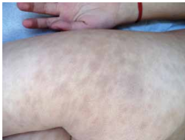
Fig. 2 - Máculas hiperpigmentadas tonalidade acastanhada envolvendo porção proximal membros inferiores.