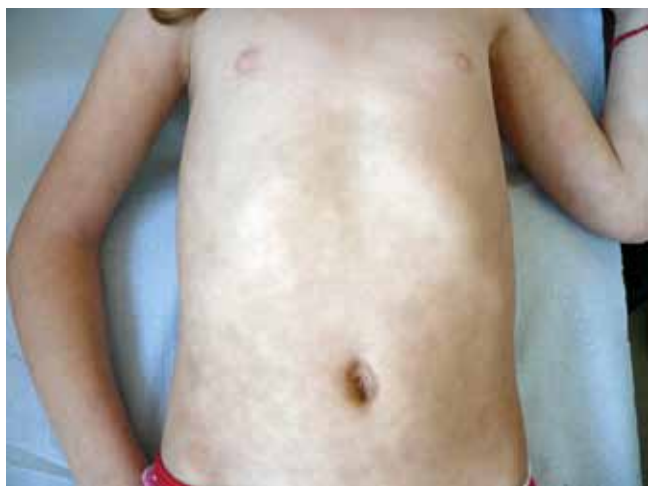
Fig. 1 - Máculas hiperpigmentadas tonalidade acastanhada envolvendo tronco.

A pigmentação macular eruptiva idiopática é uma patologia rara descrita pela primeira vez em 1978 por Degos 1 .