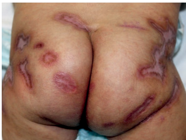
Figura 4 - Cicatrização completa das lesões após três semanas do início da corticoterapia oral. Observam-se apenas lesões residuais atróficas e pigmentadas.

(prednisolona 3 mg/kg/dia) com importante melhora do quadro em uma semana (Fig. 3) e resolução com completa cicatrização das lesões após três semanas do início da terapia (Fig. 4). A paciente obteve alta hospitalar, seguida de redução gradual da dose do corticoide em ambulatório. Atualmente, apresenta apenas cicatrizes atróficas.