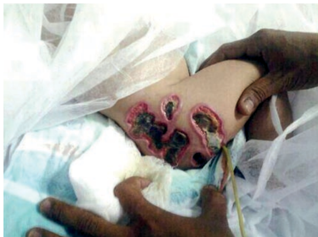
Figura 1 - Lesões ulceradas múltiplas, de fundo necrótico, na região coberta pelas fraldas.

Paciente do sexo feminino, quatro meses de idade, natural e procedente de Manaus/AM. Trata-se de lactente previamente saudável, sem antecedentes familiares relevantes, que há 20 dias apresentava início do quadro com vesículas e pústulas que evoluíram em uma semana para lesões ulceradas múltiplas, de fundo necrótico, na região coberta pelas fraldas (Fig. 1). Procurou atendimento médico e foi avaliada pela equipe de pediatria que optou por iniciar tratamento com antibioticoterapia oral de amplo espectro com vancomicina e meropenem acreditando na possível etiologia bacteriana das lesões. Após 10 dias de antibioticoterapia sem resposta foi, então, proposto desbridamento cirúrgico das lesões pela equipe da cirurgia geral. Após o procedimento cirúrgico houve agravamento do quadro