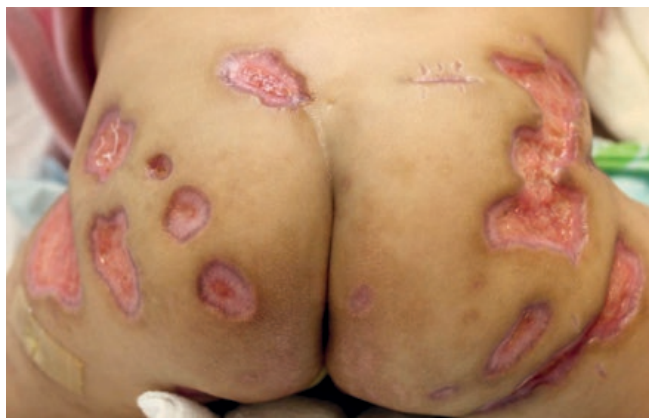
Figura 3 - Melhora parcial das lesões após uma semana do início do tratamento (prednisolona 3 mg/kg/dia).

(prednisolona 3 mg/kg/dia) com importante melhora do quadro em uma semana (Fig. 3) e resolução com completa cicatrização das lesões após três semanas do início da terapia (Fig. 4). A paciente obteve alta hospitalar, seguida de redução gradual da dose do corticoide em ambulatório. Atualmente, apresenta apenas cicatrizes atróficas.