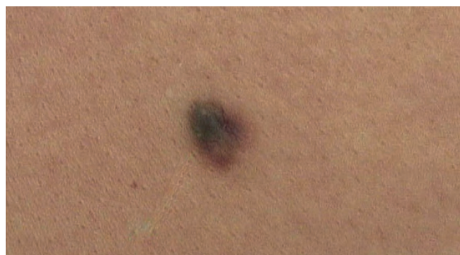
Figura 1 - Aspecto clínico da lesão: máculo-pápula assimétrica, de cor heterogênea.