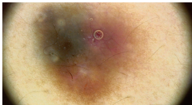
Figura 2 - Lesão observada à dermatoscopia digital (FotoFinder Medicam 1000®): lesão assimétrica na estrutura e na cor.

de diâmetro, bem delimitada, com bordo irregular e várias cores de distribuição heterogênea (azul-acinzentada, rosa e castanho claro) (Fig. 1).