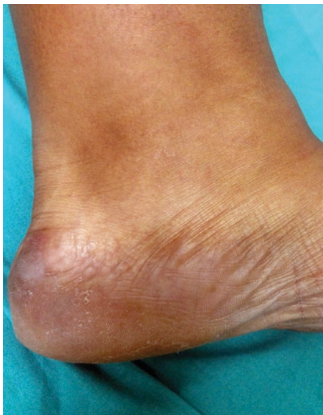
Figura 1 - Região de calcanhar esquerdo, antes da imersão em água, evidenciando apenas descamação superficial.

A paciente continuou em acompanhamento na Dermatologia, referindo melhora dos sintomas com os cuidados orientados.