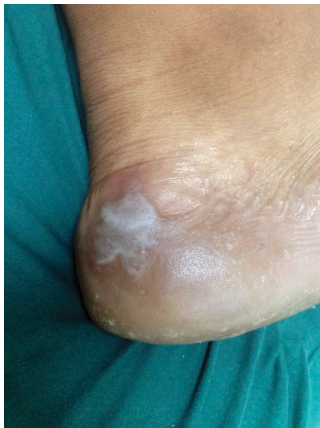
Figura 2 - Após 5 minutos em imersão na água de torneira à temperatura ambiente, evidencia-se pápulas hipocrômicas, edematosas, com alguns óstios glandulares dilatados, limites bem definidos, coalescendo em placa maior.

A queratodermia aquagénica palmo plantar (QAPP) é uma entidade rara que se caracteriza pelo surgimento de edema, pápulas hipocrômicas, com dilatação dos óstios das glândulas sudoríparas nas regiões de palmas e, mais raramente, plantas, após contato de segundos até cinco minutos